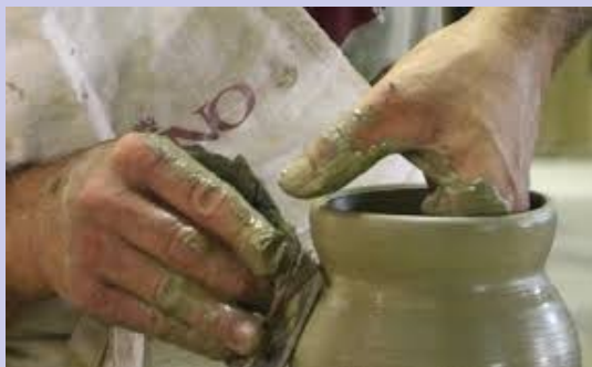
Nelle mani del vasaio

Si vive una volta sola e non vogliamo essere "giocati" in nome di nessun piccolo interesse.